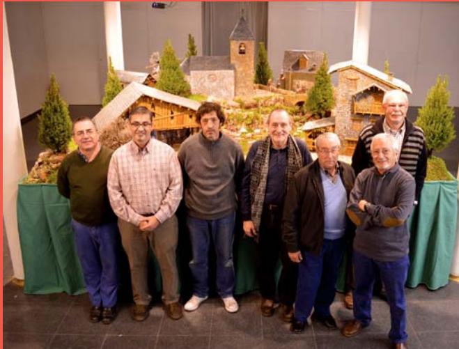
Els pessebristes, un any més, ens mostren la seva creativitat