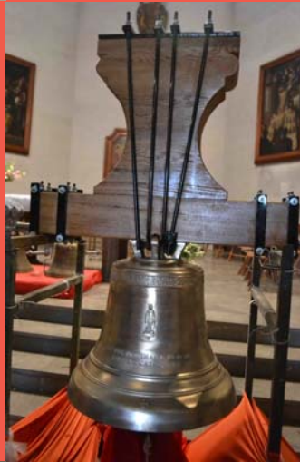
La Jordina i la Mare de Déu de la Cisa, les noves campanes de Teià